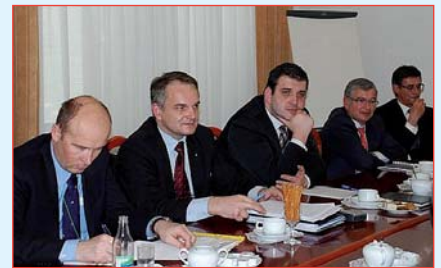
La délégation du MEDEF au Ministère de l'Economie

Lors de l'entretien le Vice-Premier Ministre W. PAWLAK a présenté les priorités gouvernementales et les objectifs stratégiques de l'économie polonaise. Il a évoqué une grande volonté du gouvernement polonais d'établir de meilleures conditions pour le développement économique et social du pays.