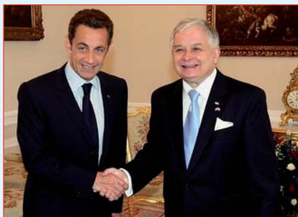
Le Président Nicolas Sarkozy et le Président Lech Kaczyński

Pour le Président Nicolas SARKOZY la rencontre avec le Président Lech KACZYNSKI fait partie