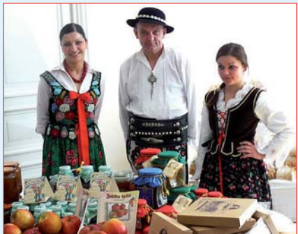
Produits polonais du terroir