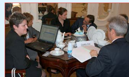
Les négociations pendant la Journée de la promotion de verrerie et de porcelaine