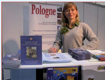
Le stand de la Pologne

Le Service de la Promotion et des Investissements de l'Ambassade de la Pologne disposait de son stand au SHOP INNOVATION où il a mis à disposition des visiteurs la documentation concernant l'économie polonaise, les investissements, la