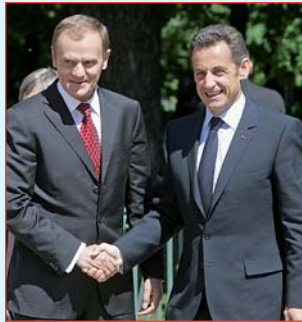
Le Premier Ministre polonais Donald Tusk et le Président Nicolas Sarkozy

Dans le deuxième parti de la visite le Président SARKOZY a été reçu au Palais sur l'Eau par le Premier ministre polonais M. Donald TUSK. Lors de cet entretien Nicolas SARKOZY a souligné l'importance du soutien polonais pour réussir la présidence française de l'UE. Les deux politiciens ont signé le programme de la coopération dans le