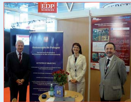
Stand polonais au Salon SERI

Les thèmes majeures de cette édition étaient : l'énergie, les changements climatiques, le développement durable, la protection de l'environnement. Un programme d'évènements et d'animations variés a été organisé pour des