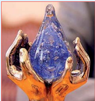
Le Trophée symbolisant l'investissement valeur de l'eau pour la vie

Une session plénière a été organisée ayant pour thème de cette année la protection du littoral. Lors des sessions thématiques un accent a été mis sur les conséquences des changements climatiques et leur impact sur l'eau, la gestion sociale de l'eau, son assainissement et traitement. Les sujets principaux de nombreuses tables rondes ont été : changements climatiques dans les zones littorales (ex. la Méditerranée), changements hydrologiques des rivières de montagne (ex. des