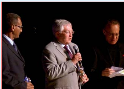
Le Professeur Marek GROMIEC (au centre)

Raoul CARUBA de l'Université Nice-Sophia Antipolis et organisé sous l'auspice de l'UNESCO, des Universités des Nations Unies et de Nice Sophia Antipolis et de la ville de Cannes. Pour sa 10 e édition, le Symposium International de l'Eau a revêtu un caractère exceptionnel. A cette occasion les représentants des cinq Continents ont été invités à Cannes – Capitale Mondiale de l'Eau.