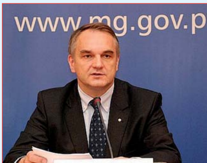
Le Vice-Premier ministre et ministre de l'Economie Waldemar PAWLAK