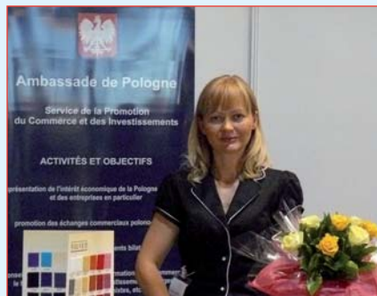
Le stand polonais

Tissu Premier est l'une des plus importantes manifestations professionnelles en Europe dédiée à la mode et aux innovations dans le textile et de l'habillement. Elle dévoile les nouvelles tendances pour les prochaines saisons en matière de tissus, maille et impression, des accessoires et fournitures textiles, du tissé teint,