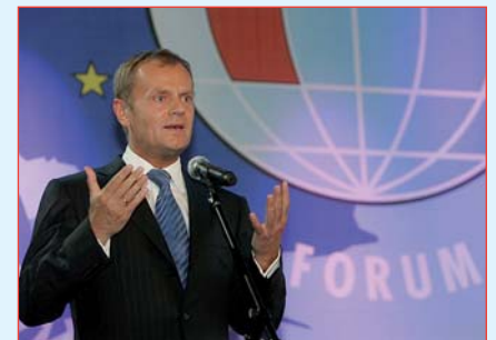
Le Premier ministre Donald TUSK

Le but du Forum est de développer et renforcer le dialogue et la coopération entre les Etats membres de l'Union européenne et ses voisins, de favoriser le partenariat commercial, le rap-