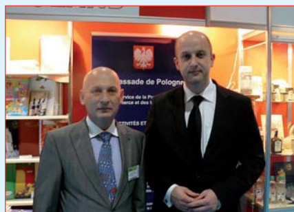
L'ambassadeur de Pologne, M. Tomasz ORLOWSKI (à gauche) et le ministre de l'Agriculture, M. Andrzej DYCHA

Du 19 au 23 octobre dernier au Parc des Expositions de Paris-Nord Villepinte s'est déroulée la 23 e édition du Salon International de l'Alimentation SIAL, le plus grand salon du secteur agroalimentaire au monde. Une manifestation organisée tous les deux ans depuis 1964, le SIAL est une plate-forme de rencontres des professionnels du marché mondial de l'agroalimentaire. Il rassemble tous les acteurs de cette filière, des plus