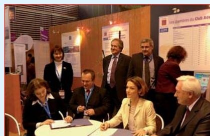
Signature de l'accord entre ADME et NFOSiGW.

Durant la conférence intitulée « Technologies environnementales en Pologne – possibilités pour la science et possibilités des affaires », la représentante du Service de la Promotion du