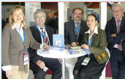
Le Pavillon polonais à POLLUTEC.

Lors du Salon la Pologne a disposé de son pavillon national dont le mot d'ordre était : « La science polonaise et les innovations pour l'environnement ». Il a été organisé par l'Institut d'Ecologie des Terrains Industriels de Katowice en collaboration avec le Service de la Promotion