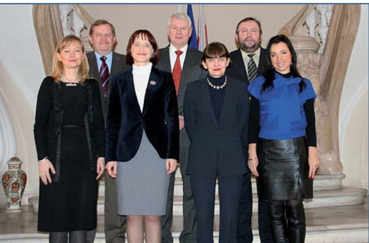
L'Equipe du Service de la Promotion du Commerce et des Investissements de l'Ambassade de Pologne :

J'espère que cette « Revue Economique » vous permettra de connaître et de comprendre encore mieux la situation économique, politique et culturelle de la Pologne ainsi que d'enrichir les relations entre nos deux pays.